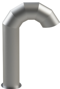
Utförande segmenterad Ø 300-500