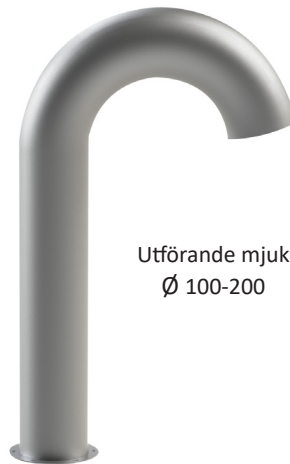
Utförande mjuk Ø 100-200